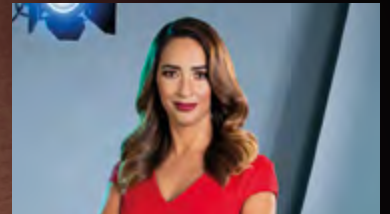
PAOLA VIRRUETA CONDUCTORA UNIVISION NOTICIAS